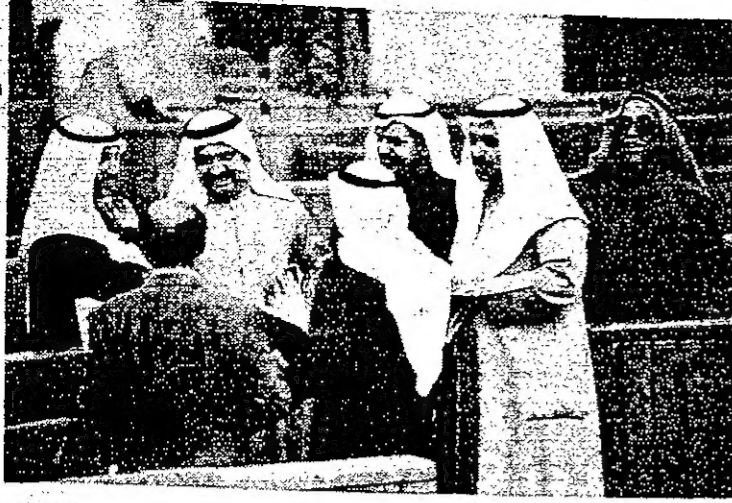
مشاروات قبل رفع الجلسة بين سبعة اعضاء